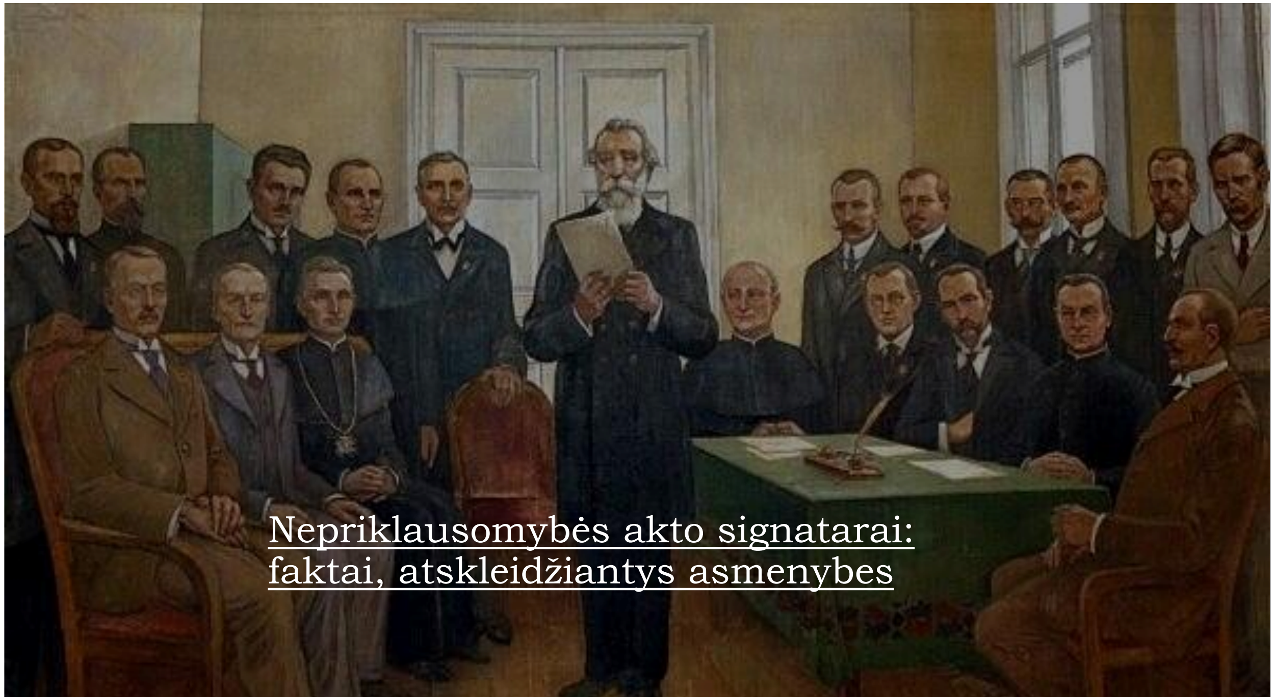
Nepriklausomybės akto signatarai: faktai, atskleidžiantys asmenybes