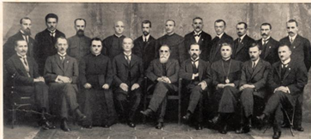
A73-9355 PIRMOJI LIETUVOS VALSTYBĖS TARYBA, kuri 1918 m. vasario mėn. 16 d. pasirašė Lietuvos Nepriklausomybės aktą. Iš kairės į dešinę sėdi: J. Vileišis, dr. J. Šaulys, kun. J. Staupaitis, St. Narutavičius, dr. J. Basanavičius, A. Smetona, kan. K. Šaulys, Stp. Kairys, p. Smilgevičius. Stovi: K. Bizauskas, J. Valiokaitis, Donatas Malinauskas, kun. Vl. Mironas, M. Biržiška, kun. A. Petrušis, S. Banaitis, P. Kilmas, A. Stulginskis, J. Šernas, Pr. Dovydatis Premier Conseil d'Etat Lithuanien qui a signé, le 16 février 1918, l'acte proclamant l'indépendance de la Lithuanie

(Handwritten signatures of the members of the Lithuanian Council of State)